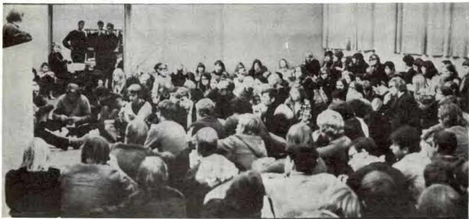
Stor oppslutning om møtene på «Katta»