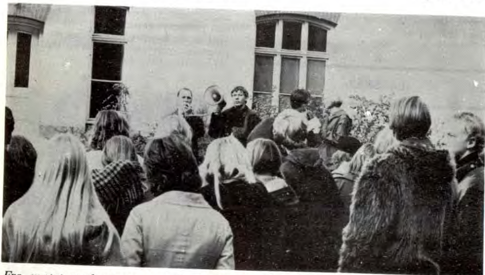
Fra møtet med representant fra Sporveien. Møtet måtte holdes i skolegården, da rektor nektet elevene lokaler.