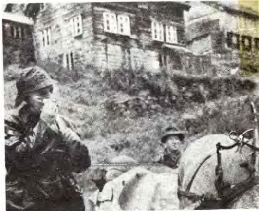
Stadig flere gårder blir fraflytta.

Lurøy kommune har konkrete planer om å innføre niårig skole, men den økonomiske ramme tillater ikke bygging av mer enn en, høyst to skoler. Dette har skapt strid mellinnbyggerne om skolens beliggenhet. Skolekretsene spilles ut mot hverandre og spliden fører til at den virkelige fienden tildekkes. Monopol-