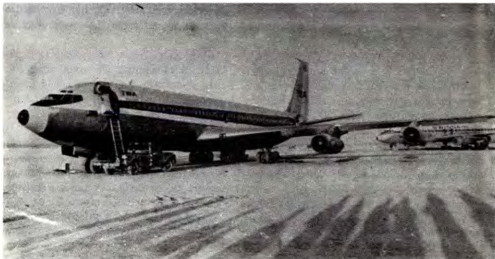
Fly kapret av PFLP

Flykapringene som er et ledd i denne eventyrpolitikken tar marxist-leninister derfor avstand fra. Kapringene reduserer