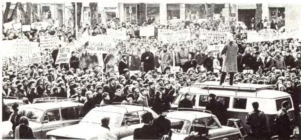
Fra studentenes militante demonstrasjon utenfor Regjeringsbygget i Oslo.