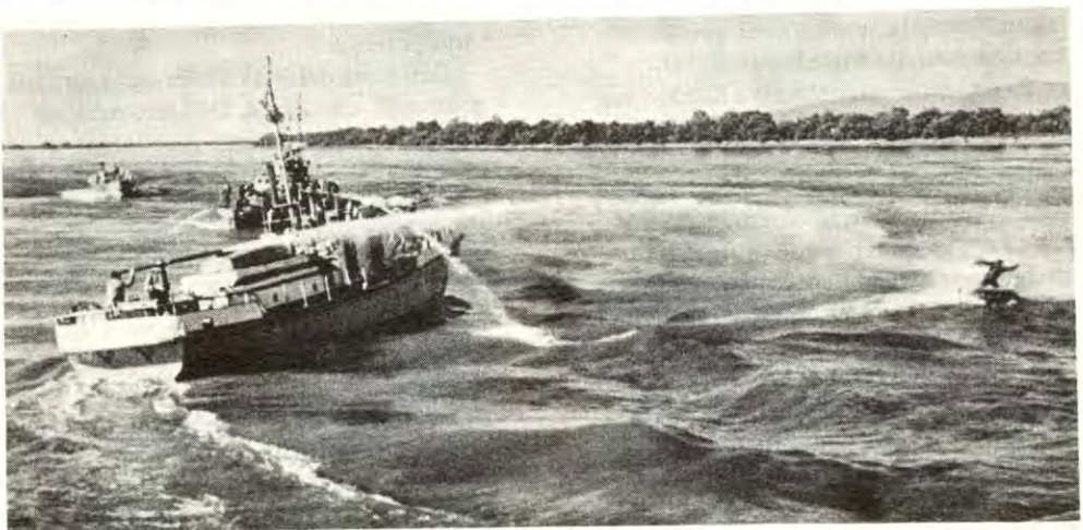
Sovjetrevisjonistene bruker vannkanon mot en kinesisk fisker på Ussuri-elva.