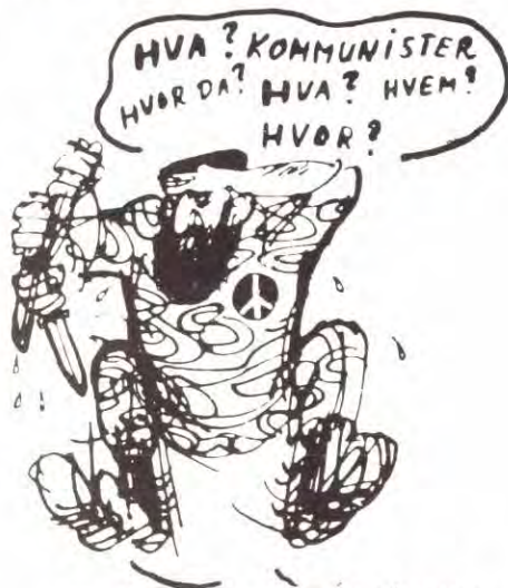
SF/NKP-pampene berserk i frontene.

støtte aktivt opp om en all-europeisk sikkerhetsallianse. Dette vil bety et nærere samarbeid mellom USA og Sovjet, og gjennom denne alliansen kan disse landa på en bedre måte fortsette sin undertrykkelse av folkene i Warszawa- og NATO-pakten.