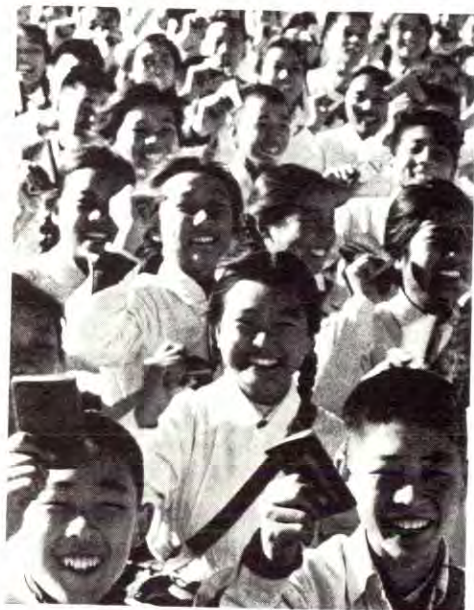
Ungdommen i Kina deltar begeistret i oppbygginga av sosialismen.

På en lavere middelskole i Kanton ser vi dette særlig godt. Denne skolen er knyttet fast sammen med en metallfabrikk, og arbeiderne der har daglig kontakt med skolen, fordi det er arbeiderne som underviser i mange timer. Under kulturrevolusjonen som betydde det avgjørende slaget mellom den gamle og den nye linja i undervisninga, sa de som hadde ført den gamle linja: »Arbeiderne vet så lite, hvordan skal de kunne lede en stor skole som dette?» Svaret som de fikk var helt klart. »Hvem er skolen for? Hvem betaler for den? Hva slags mennesker skal den utvikle? 95 prosent av elevene kommer fra arbeiderhjem