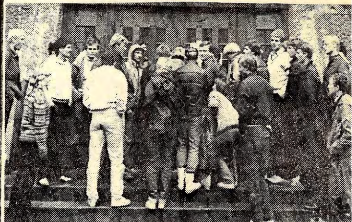
Ved navneoppropet på trappa foran Gamle Kjem i går kveld regnet ei med at køen ville vere på over hundre husløse studenter idet Student samskipnadens hybelformidling åpner i dag.