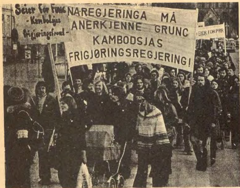
FRA DEMONSTRASJONEN I TRONDHEIM 10/4 TIL STØTTE FOR DET INDO-KINESISKE FOLKETS FRIGJØRINGSKAMP