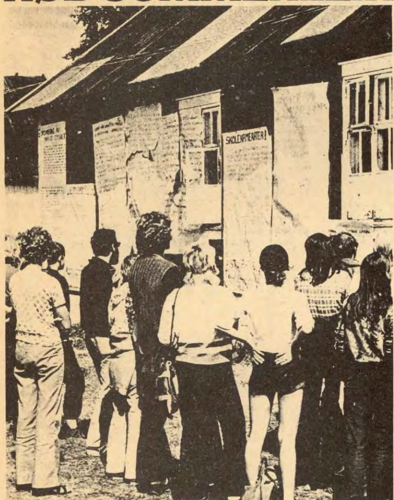
NKS SIN SOMMARLEIR 1976 BLIR KYRKJÆTERØRA I TIDSROMET 17.-24. AUG.