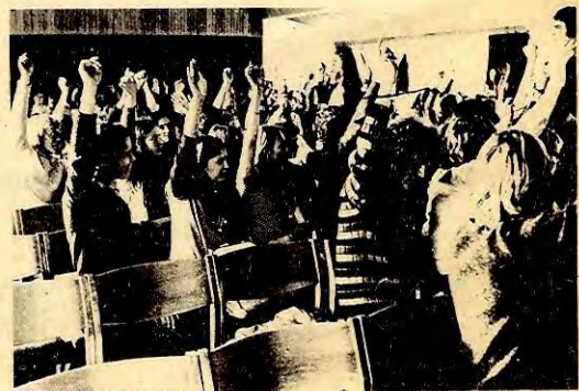
↑ FOR AKSJON