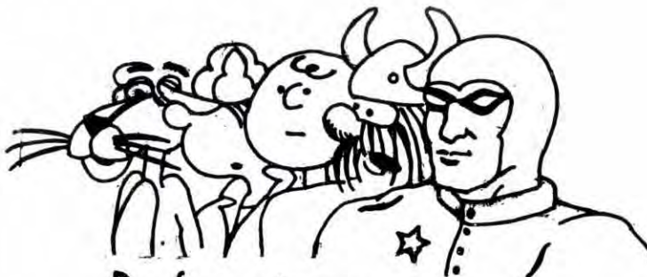
De fem store

Vil du bli med i NKS? Vil du gå på marxistisk studiesirkel? Ta kontakt med oss. Vi har bokdisk på Sentret hver onsdag fra 11.00 til 14.00.