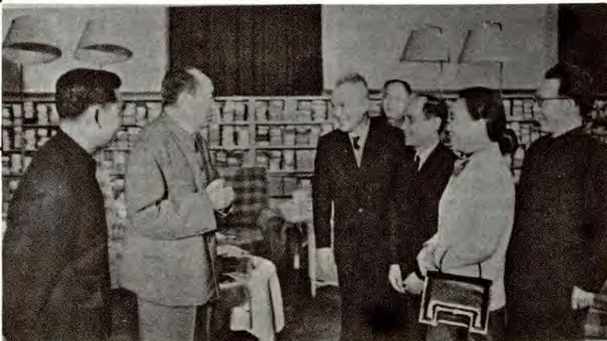
formann Mao Tsetung i samtale med ledere fra Sør-Vietnam.

Vi ventar også i spenning på "Vestavinds" svar. Då får vi sjå om redaksjonen er viljug til å diskutere internasjonale spørsmål som vel er meire viktige enn Botswanas innan- og utanrikspolitik.