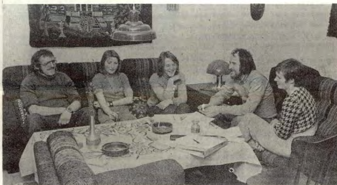
Nokre av dei streikande ved husleigestreiken i drabantbyen Risvollan i Trondheim.

Vi i NKS støtter flertallet av leieboerne på