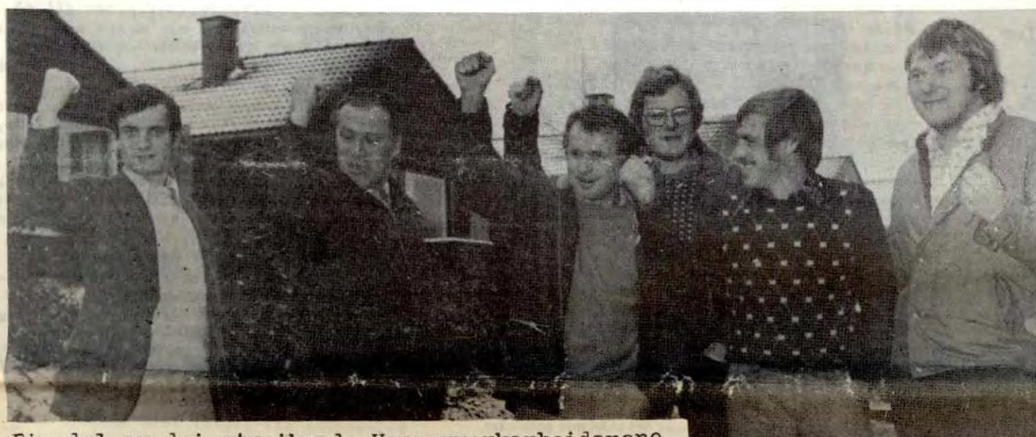
Ein del av dei streikande Hammerverkarbeidarane

Streikestøttearbeidet er i framgang både på Universitetet, på andre høgere læresteder, i Bergen generelt og på landsbasis. Skjerpningen i klassekampen viser stadig klarere hvor nødvendig permanent organisering av streikestøttearbeidet er. Streikestøttekomiteene (SSK) er en landsomfattende bevegelse. Bare i Bergen er det 15 lokale SSK, inkl. den på Univ., som er en egen lokalkom. SSK på Univ. er videre delt inn i 9 lokalkomiteer på institutt, fakultet og studentbyer.