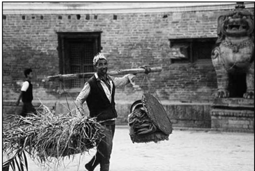
Over: Trafikkbildet i Nepal er mangfoldig. I tillegg til motoriserte kjøretøyer er både kvinner og menn vant til å bære tungt