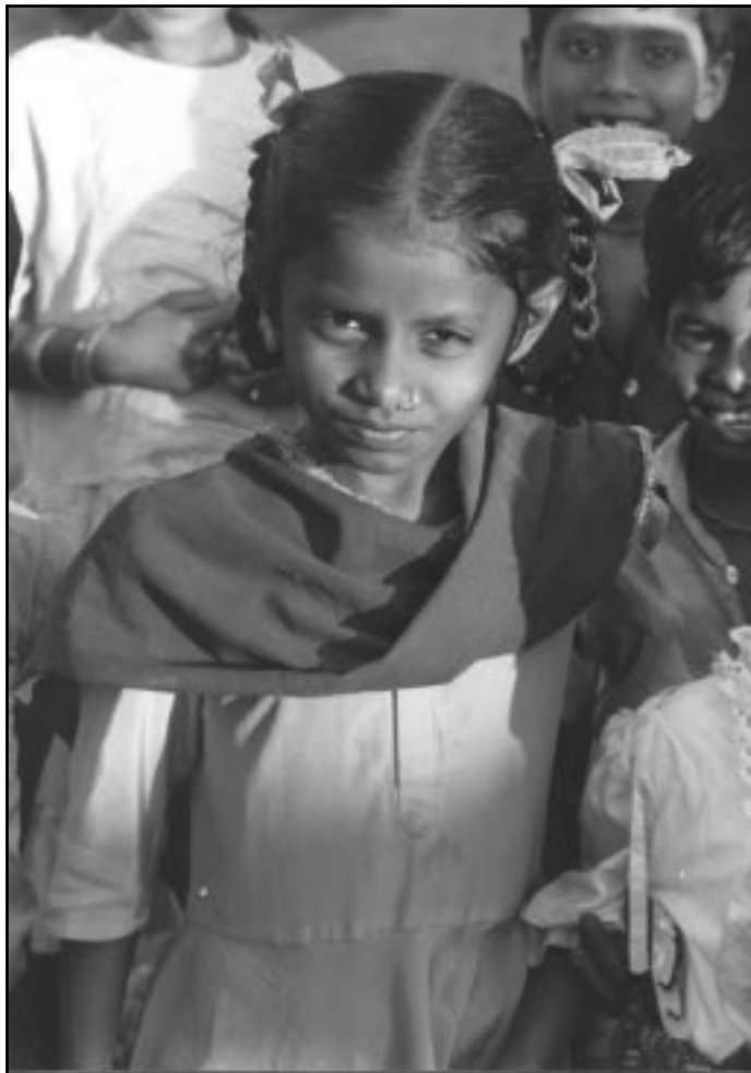
Bildet: Den indiske arbeideren - mann med hjelm, eller lita jente?

«Demand for Capital Punishment», i «Women's voice» AIPWA, 1994