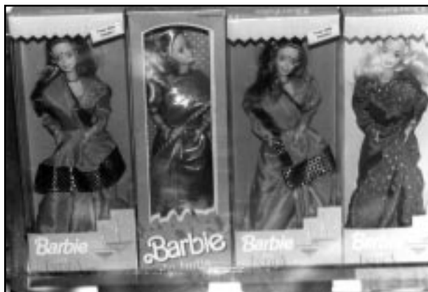
Brudedokker i sari med «kastemerke» i panna selges nå i India