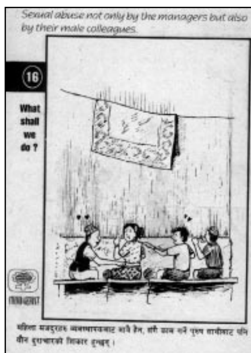
Illustrasjon fra «tegnserieheftet» som GEFONT har lagd for å rekruttere kvinner

All Nepal Women's Association (ANWA) ble stiftet i 1950. Helt fra begynnelsen av har de kjempet mot alle typer kvinnediskriminering på sosiale, økonomiske, juridiske og