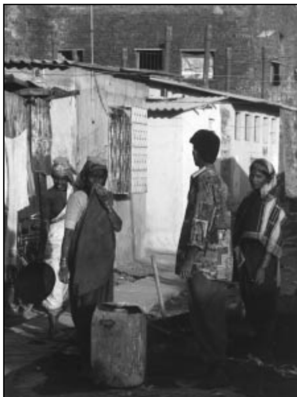
Bildet: Den strukturelle volden bidrar til å opprettholde den vanvittig skeive fordelinga mellom fattig og rik. Bildet viser beboere i et av Bombays slumområ-