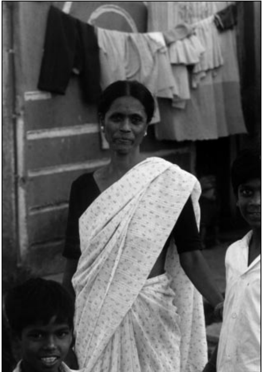
Det er stor avstand mellom livet i «slumbyen» Bombay og det glitrende skjønnhetsbildet som Miss World konkurransen representerer

Når vi i Norge har aksjonert mot toppløsbare, stripping, missekonskurranser og porno har fløyta hatt samme låt. Når jeg og ei anna jente blei intervjuet av P4 som aksjonsledere for en demonstrasjon mot NM i stripping blei vi spurt om størrelsen på puppene våre. Når vi aksjonerer mot Hennes & Mauritz - plakatene skriver tabloidene «morsomt» om menn som kræsjer på motorveien fordi de ikke kan ta øya vekk, og om rødstrømpene som vil ta fra dem «retten til å se på pene damer». Motstand mot salg av kvinnekroppen har blitt forsøkt latterliggjort som puritanisme og sjalusi - her som i India. Men hvem er det som protesterer i India, og hva sier de sjøl om hvorfor?