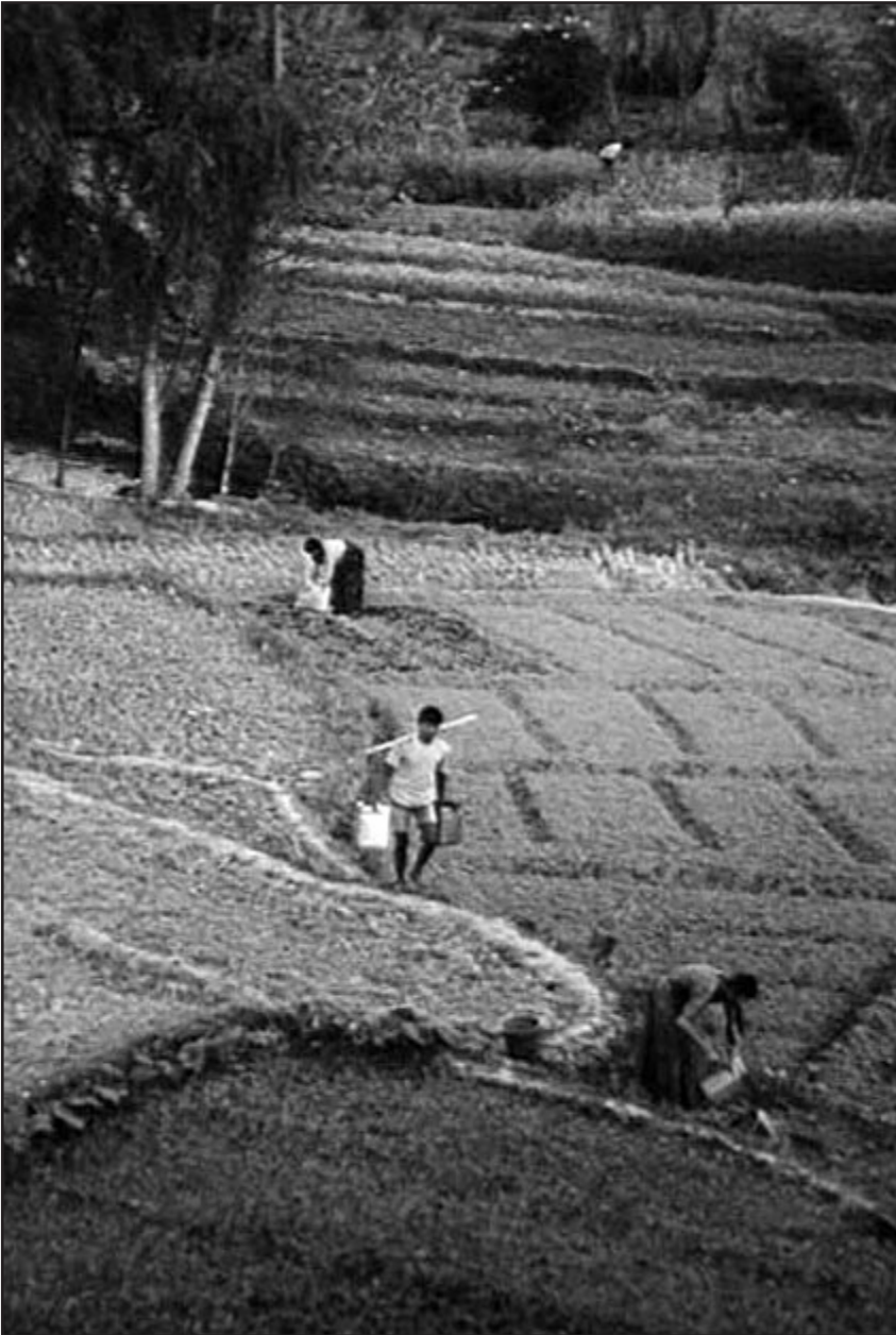
Over: Risdyrking krever mye vann. Her får kvinnene hjelp til vannbæringa av en unggutt.

- Men det stemmer jo helt. Den teknologien dere ikke har bruk for lenger sender dere til oss. Vi ligger 40 år etter dere i teknologi.