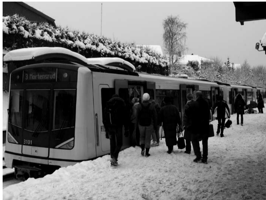
En av de nye T-banevognene.

Det som skjedde 22. november var den største seieren arbeiderklassen vant i Oslo bystyre i fjor. Byrådet hadde ikke lenger kontrollen, og det syntes på dem. Galleriet var overfylt av verkstedarbeidere. Byrådet fikk merke at organiserte arbeidere har makt. Det var nok helt utålelig for blårusen i Rådhuset.