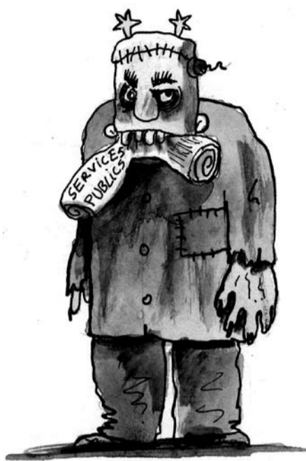
Fritz Bolkestein var sjef for EUs indre marked. I 2004 la han fram forslag til et tjenstedirektiv, Bolkestein-direktivet.

del av velferden. De kutter pensjonene og vil at arbeiderklassen skal jobbe lenger for mindre penger.