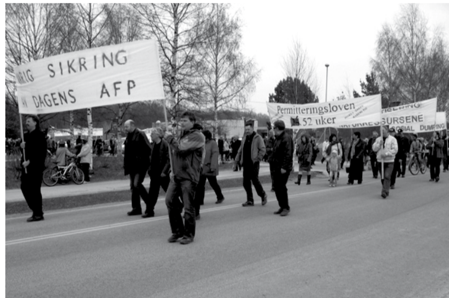
Aker Verdal-klubben 1. mai 2006.

c/o Verkstedklubben Aker Verdal Aker Kværner Verdal AS 7650 Verdal Kontonummer 4202 08 64626 Besøk hjemmesida for mer informasjon: www.forsvarafp.no .