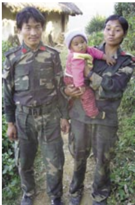
Mann og kone leder hvert sitt kompani i frigjøringshæren.

Fram til i fjor sommer har regimet blitt støtta av USA, India, EU, Israel, Kina og Pakistan. Men den åpne støtten er nå vanskeligere å gi. Maoistene i Nepal samarbeider med andre frigjøringsbevegelser og demokratiske krefter blant annet i India. Men de stoler på egne krefter i sin egen kamp.