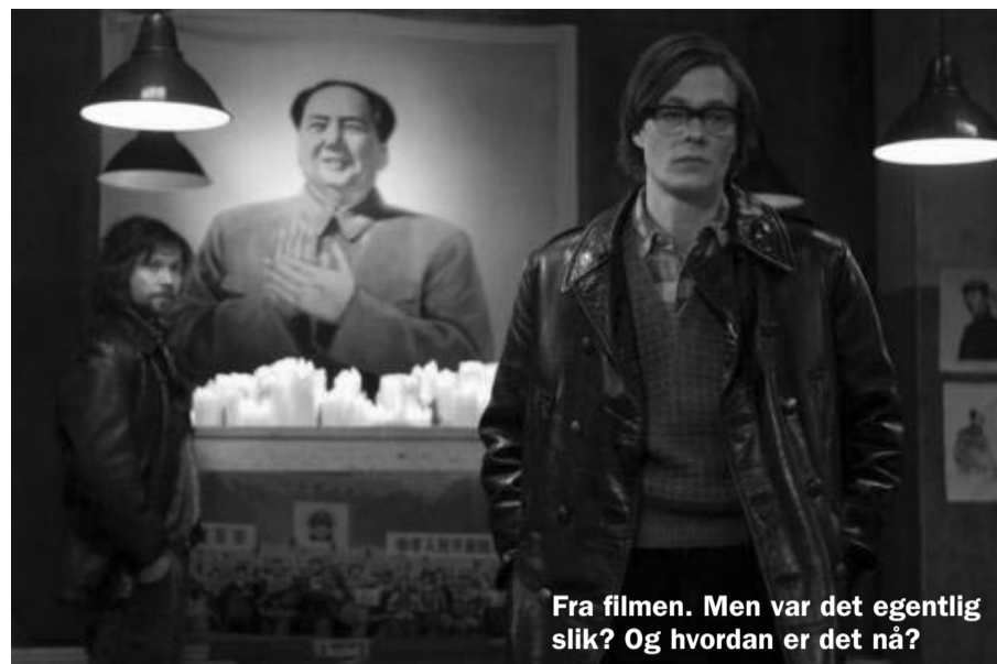
Fra filmen. Men var det egentlig slik? Og hvordan er det nå?

Revolusjonære kan drepes eller fengsles, nektes jobb eller bare latterliggjøres. Men kapitalismen skaper de samme spørsmålene i nye menneskers tanker. Derfor vil det hele tida oppstå sosialister og kommunister, reformvennlige sosialdemokrater, feminister, antiimperialister og antirasister. Ikke fordi de først og fremst er drevet av et religiøst bilde av himmelriket, men fordi de plages så inderlig av kapitalismen slik de erfarer den. De gjør det de kan i stort og smått for å forandre samfunnet rundt seg. Slik forandra også