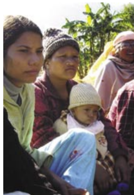
Representanter for kvinneorganisasjonen All Nepal Women's Association (revolutionary)

Maoistene blir kritisert fordi de tyr til våpen for å få til endring, og at dette koster menneskeliv. Men hvordan teller man menneskeliv? Når 12 000 jenter hvert år blir solgt til prostitusjon og 70 prosent av disse får HIV, utvikler aids og dør en tidlig og smertefull død – teller ikke deres liv? Og når barn må arbeide i steinbrudd og blir skada og drept i farlig arbeid – teller ikke deres liv? Hittil har 2 500 kvinnelige frigjøringskrieger ofra sine liv for sine søstre og brødre i kampen for et Nepal frigjort fra føydalisme, prostitusjon og kvinneundertrykking.