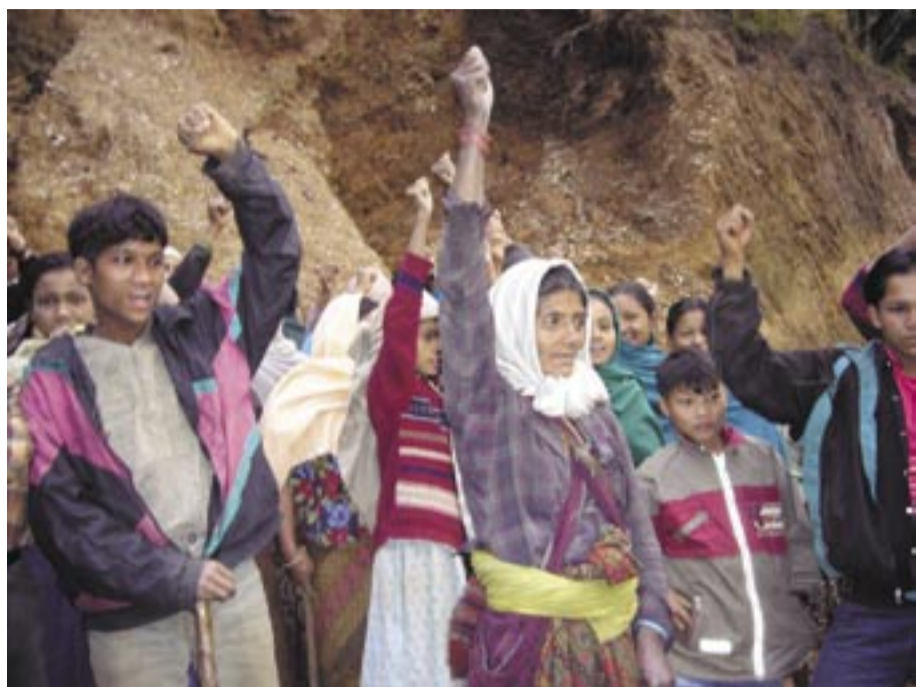
Laal Salam! Rød hilsen! Landsbyboere i et frigjort område.