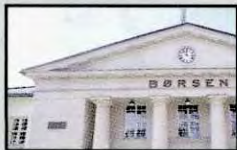
I stedet for at noen få storselskaper eier ressursene kan vi styre dem demokratisk - i fellesskap.

- da bør du besøke sosialisme.no (og få en banan)