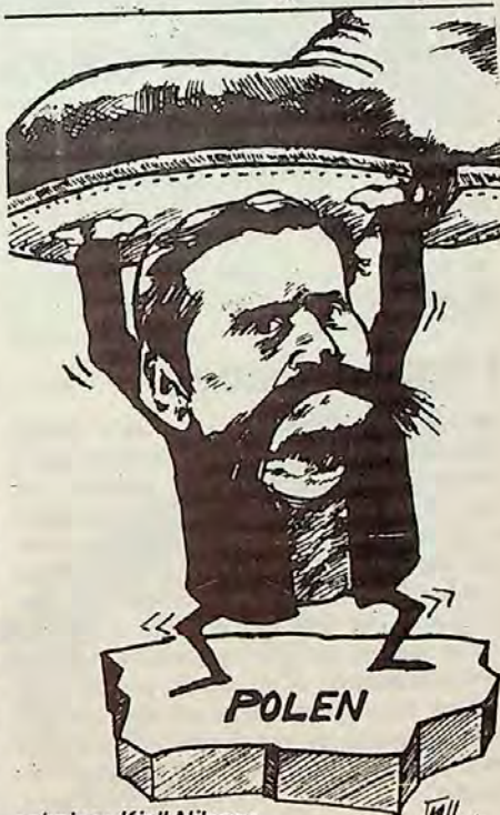
teckning: Kjell Nilsson

Sentralstyret mener spesielt mulighetene er store på arbeidsplassene og blant arbeiderungdommen. Derfor må de faglige laga og de fagorganiserte kameratene i ungdomsforbundet, se det som sin særskilte