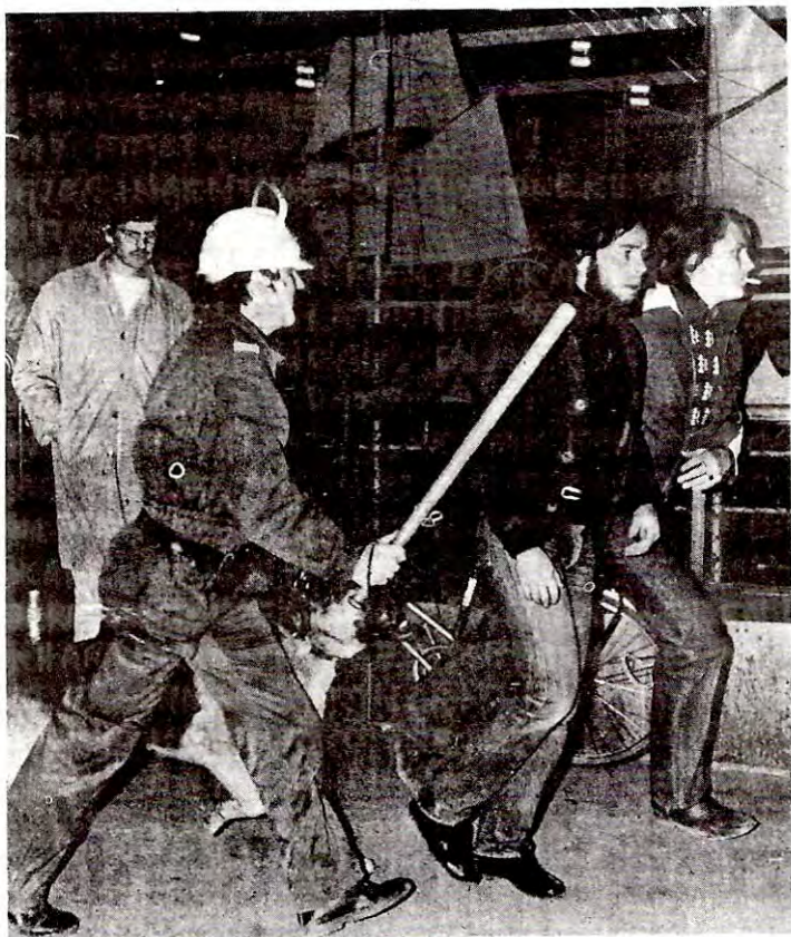
Fra slaget i Slottsparken, Oslo, 30. april 1978.