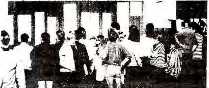
Fra veggavisdebatten på SUFs sommerleiri 1968.

fra etter invasjonen i Tsjekkoslovakia spredde våre egne løpesedler med en korrekt analyse av hva som foregikk.