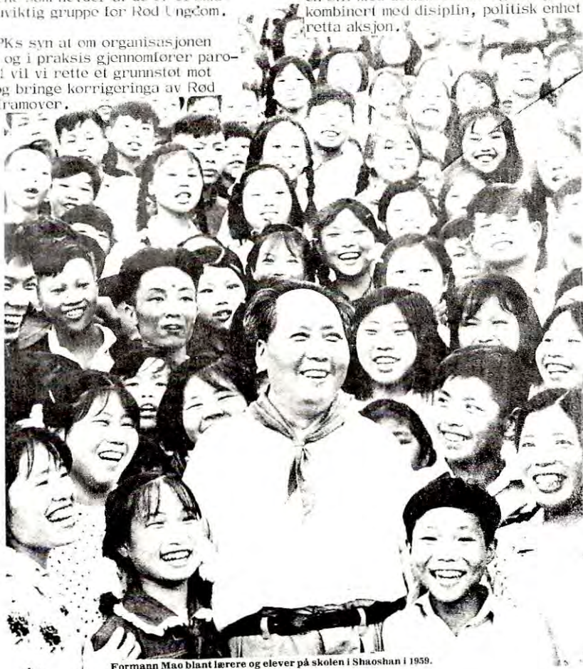
Formann Mao blant lærere og elever på skolen i Shaoshan i 1959.

Grunnorganisasjonen er hjørnesteinen i en kommunistisk kamporganisasjon som Rød Ungdom. I motsetning til revisjonistene og de andre borgertlige ungdomsorganisasjonene er vi ikke ei ansamling mer eller mindre papirmedlemmer som er laust sammensatt. Nei, en kamporganisasjon må være en organisasjon av kjempende enheter som er fast organisert, der det hersker en stil med demokratiske og livlige diskusjoner kombinert med disiplin, politisk enhet og utadretta aksjon.