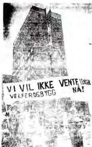
Yrkesskoleelever demonstrerer utenfor Rådhuset i Oslo.

Du har rett i at yrkesskoleelevene er ei viktigere gruppe for et kommunistisk ungdomsforbund å jobbe blant, og at disse i en del forhold også er mer framskredne enn gymnasiastene. Årsaken til dette er at det blant yrkesskoleelevene er et stort flertall som kommer fra proletariatet og som sjøl er på vei inn i denne klassen. Men du bruker dette først og fremst som et alibi for å fremme ei reaksjonær linje overfor gymnasiastene. Du benekter i virkeligheten at det også på gymnaset er et stort innslag av ungdom fra arbeiderklassen, at gymnasiastene har vist seg svært kampvillige, og at det store flertallet av gymnasiastene velger rett side i klassekampen når kommunistene fremmer ei rett linje blandt dem.