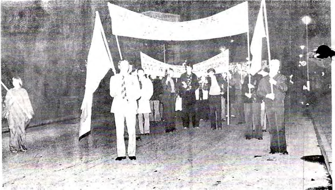
BILDET: Fra fakkelloget i Odda 16/10