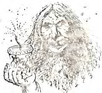
Flendent kan være alt fra en bombekastende kommunistrotte, til en bombekastende helsekost fanatiker.

Grunnen til at jeg er med i RU er at jeg har innsett nødvendigheten av organisering, av kampen mot kapitalismen, og da er RU det eneste alternativet for meg. Men for at RU skal bli en kraft i kampen mot jevelskapet, er vi avhengig av en aktiv og levende medlemsmasse. Dette er ikke bare en forutsetning for at vi skal kunne dra i samme retning, men det er også en forutsetning for at vi skal få et virkelig demokrati i organisasjonen.