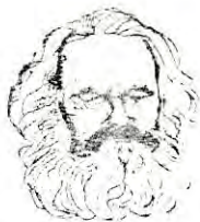
Målfolk og alle arbeiderklassene: Så ser det!

I ein situasjon der ein person får medveten om at hans eget språk er nødvendig får han eit behov for å oppvurdere sitt eget. Det er da viktig å vera klar over at det viktigaste er ikkje å markere ikkje-bokmål . For når ein oppdagar at bokmål ikkje er eins eget språk, vil ein gjerne markere avvik. Dermed står ein i fare for at ideologien har tatt innersvingen på ein . Vi trur vi er frigjorde, men så er det ein ny ideologi som gjer at ein ikkje oppdagar undertrykkinga.