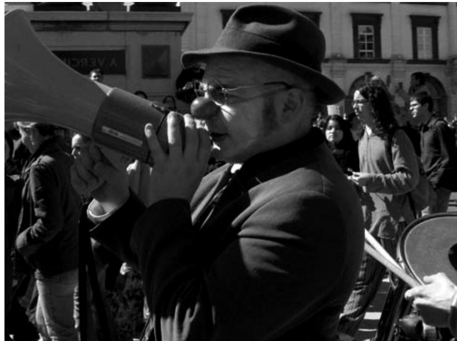
Demonstrant fra Klovner mot CPE.

EU presser på i bakgrunnen. Den generelle politikken er dereguleringer over hele fjøla.