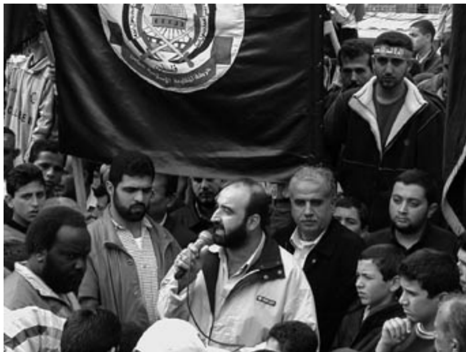
Hamas er nå det største partiet i Palestina. Den islamske valgseieren er et uttrykk for at palestinerne ønsker slutt på korrupsjonen og fortsatt motstand mot Israel.

Den nye regjeringen består bare av medlemmer fra Hamas og uavhengige «teknokrater». Men at regjeringen ikke