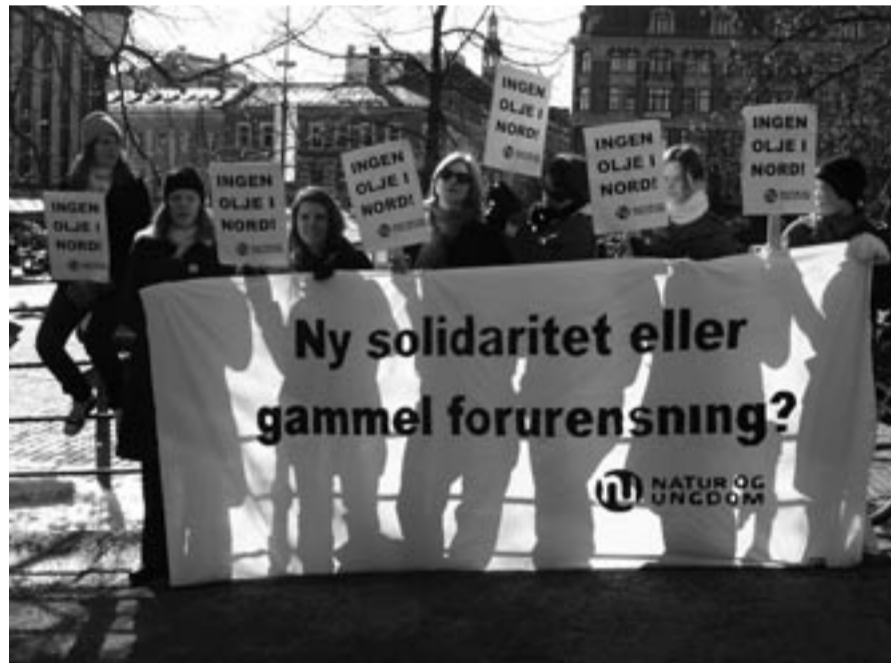
Natur og Ungdom demonstrerer utanfor Arbeidarpartiet sitt landsstyremøte.

kjemisk industri, tobakksindustri osv. Overskotet på den nasjonale handelsbalansen (eksport minus import) var på omtrent 300 milliardar kroner – eller 17 prosent av BNP.